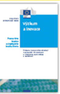
Výzkum a inovace